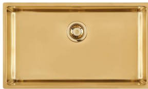
Fregadero KE Gold