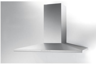
Campana extractora Amélie